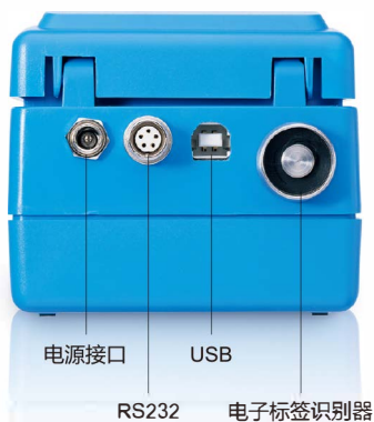
电源接口 USB RS232 电子标签识别器