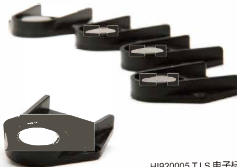
HI920005 T.I.S 电子标签

HI93414 是一款高精度多参数便携式测定仪，巧妙的将浊度、余氯、总氯三项参数测量相结合，适用于饮用水行业的首选多功能一体机；具有不同测量范围选择，低浊度量程（0.00 to 9.99NTU）和高浊度量程（100 to 1000NTU），特别在低值范围内具有极高的准确性、精确度，适用于不同领域不同浓度样品的测量。余氯、总氯（0.00 to 5.00mg/L）测量，满足不同领域各项需求和对测量精度的保证；HI93414 采用 EPA 专用定制光源，符合 USEPA 180.1 标准和 Standard Method 2130B 标准方法，微处理器通过到达检光器的光强计算出浊度值；有效的修正了颜色的干扰，具有色度补偿、光源自动补偿功能，避免了光源波动引起的干扰，无需频繁校准。